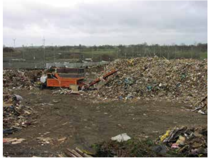
▲ 図20：廃棄物埋立場所。油分濃度の低い廃棄物は、慎重に制御された条件下で家庭廃棄物と混在させることがある。

生物的環境修復法は、油の微生物分解を加速する方法を表す用語である。このような方法の一つがランドファームであり、油とゴミは指定された範囲の土地に薄く広げられる。長年に渡り、製油所は油混じりの廃棄物を処理するためにランドファームを建設していたが、次第に規制によ