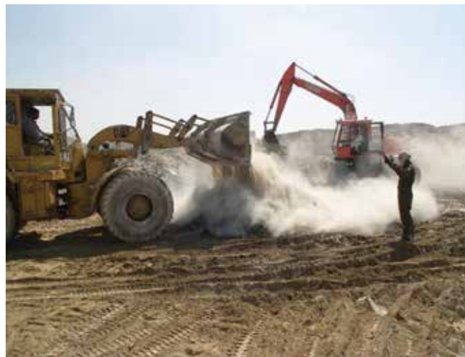
▲ 図18：生石灰を使用した油混じり廃棄物の安定化。