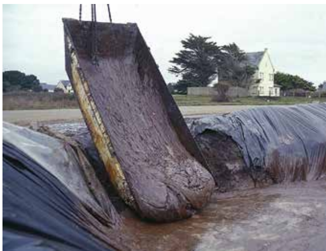
▲ 図11：乳化した重油を大型ゴミ容器から内張りした一時貯蔵ピットに移している。

油と共に回収されるゴミの量によって、廃棄物の処分が複雑になる場合が多い。ゴミが自然に集まる場所を確認するために海岸の調査を行っておけば、油が海岸に漂着しそうな場所が分ることが多い。このような海岸線で、油が到達する前にゴミを除去できる場合がある。それによって、油で汚染されてからの処分費用に比べて、ごく僅かの費用で