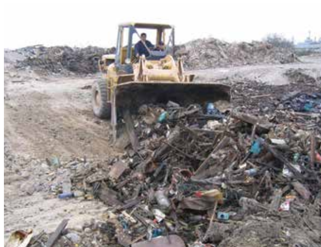
▲ 図14：油が漂着する前に海岸線からゴミを除去すれば、処分の必要な油混じりの廃棄物の量を減らす効果がある。