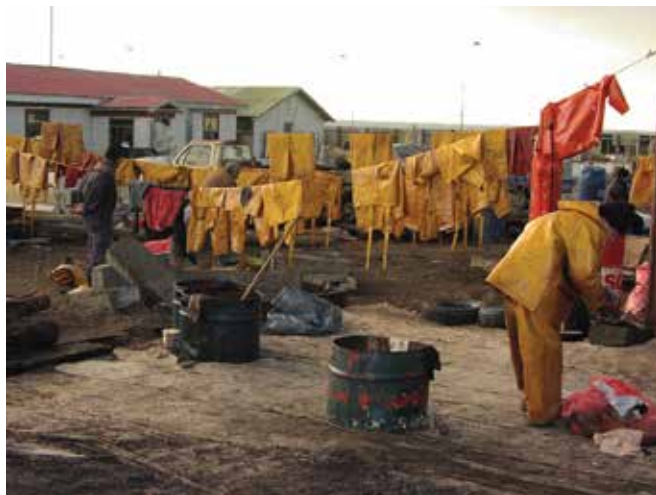
▲ 図2：廃棄物を最小限に抑えることは、油流出対応において考慮すべき非常に重要な問題である。防護服を含めて個人用保護具（PPE）は、可能であれば洗濯し再使用すべきである。

出はその性質上多くは迅速な対応が求められる緊急事態であり、また緊急時対応計画策定時に廃棄物管理に十分な注意が払われていない場合には、最も現実的で費用効果の高