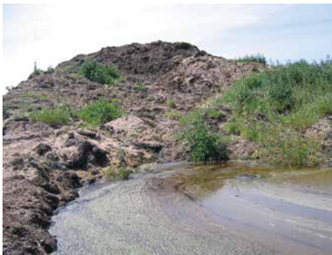
▲ 図13：一時貯蔵で積み上げられた油混じりの砂から流れ出した滲出液を捕捉し処理することにより、周辺区域と地下水の二次汚染を防止する。