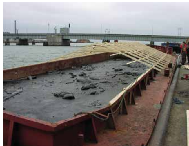
▲ 図10：舢に貯蔵された回収油。雨水が入らないように覆いが必要である。