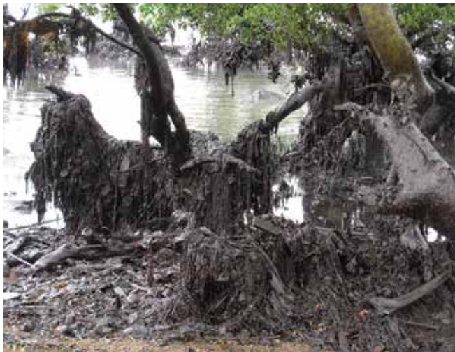
▲ 図3：船外へ失われたコンテナから流れ出たプラスチック廃棄物。油と混じり、マングローブ林に漂着した。

油混じりの廃棄物は、地域の規制に従って移送、貯蔵、処分されなければならない。国によっては、一時処分場所、及び様々な処分業務を行う請負業者について許可が必要である。事故の発生当初から規制及び許可当局との