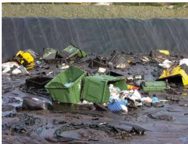
▲ 図9：ほとんど分別されていない廃棄物を入れた内張りをしたピット。後に分別と処理に多大の労力が必要になる。