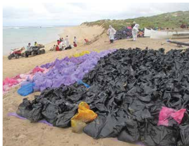
▲ 図8：油混じりの海浜の砂等を入れたプラスチック袋を一時的に高水標より上の場所に貯蔵する。滲出液を封じ込めるためにプラスチックシートを敷いてある。