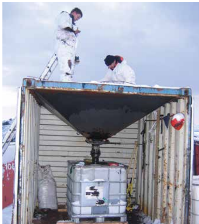
▲ 図16：間に合わせで作成された廃棄物濾過装置。回収油を格子付き漏斗に通して、ゴミを取り除く。

済む（図14）。あるいは、ゴミが集まる区域をオイルフェンスで優先的に保護して、汚染されていないゴミが油で汚染されるリスクを減らすこともできる。