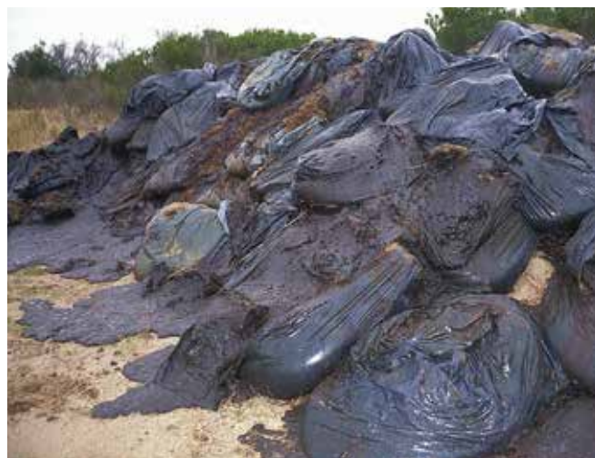
▲ 図12：プラスチック袋を長期間日光に曝しておく、劣化して再汚染に繋がる可能性がある。