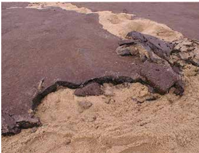
▲ 図5：砂浜に漂着した乳化油。手作業による選択的回収によって、清浄な基層の除去される量を最小限度に抑えられる。