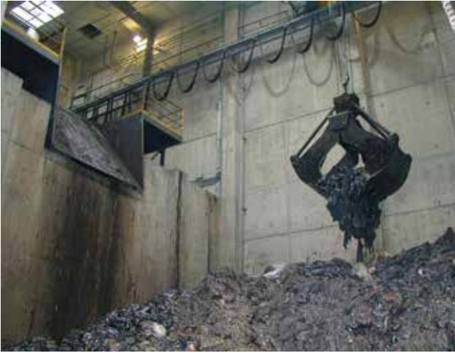
▲ 図19：家庭廃棄物との混合処分のために大型工業用焼却炉の積み込みシュートに投入される油混じり廃棄物の袋。

一般的に、家庭廃棄物用の焼却炉は大量の油の処分には適さない。海水から生成する塩化物が焼却炉の基幹部分の腐食を引き起こす場合があるためである。少量の油混じりの廃棄物と他のゴミとの混合処分の受入可能な施設も一部にはあるが、焼却温度を制御するために油混じりの廃棄物と油の混じらない廃棄物との比率を慎重に検討しなければならない(図19)。油で汚れた防護服、吸着材、網、その他の資材は、油の含有量が少ないことがあり、混焼で処理できる場合が多い。高温産業廃棄物用焼却炉は、塩分への耐性が高いと思われるが、台数に限りがあり、辺鄙な場所に設置されている場合がある。また大量の油混じり廃棄物による追加の負担に迅速に対処できるだけの十分な能力を持っていない可能性もある。しかし、油混じりの廃棄物の長期貯蔵が可能で時間をかけて廃棄物処分工程へ投入することが可能であれば、受入可能かつ効果的な処分方法になり得る。