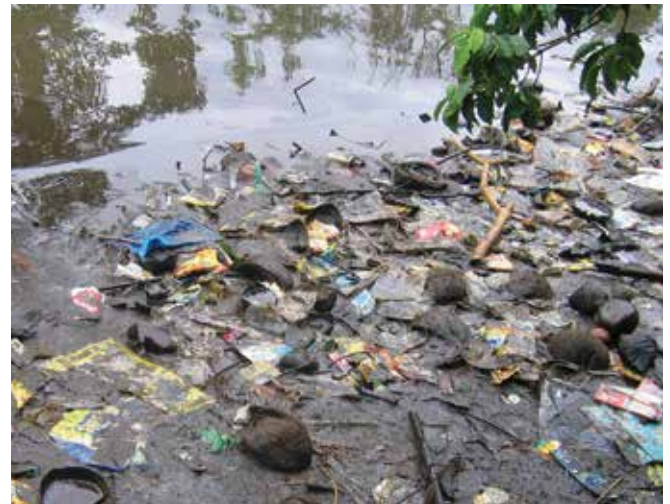
▲ 図4：廃棄されたプラスチック、家庭ゴミ、木材、植物、その他の廃棄物と混じった油。