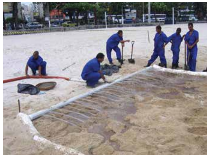
▲ 図1：低圧フラッシングによって現場で油混じりの砂を洗浄する。吸着型オイルフェンスを適切に展張して、流れ出た油を捕捉する。

「廃棄物への階層的対応」は、あらゆる形態の廃棄物に適用できる管理方法を分類し、優先順位を定めるために確立された国際的枠組であり、油流出による廃棄物の管理の基準として等しく効果的である。この階層的対応は、望ましい順に明確な5段階で構成されている。