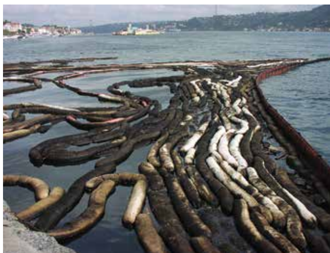
▲ 図7：部分的に油で汚染された吸着型オイルフェンス。廃棄物の発生を最小限度に抑えるため、吸着物質の大規模な使用は避けるべきである。

プラスチック袋は、日光に曝されると劣化及び分解しやすく、内容物が漏れ出るため、油混じりの物質の貯蔵ではなく移送手段と考えるべきである（図12）。内容物が処分の