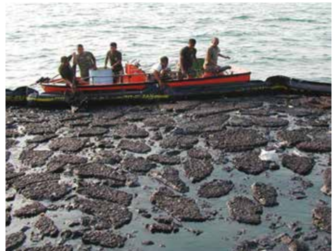
▲ 図6：オイルフェンスに封じ込められた半固体油。油をポンプで輸送することが困難なため、利用可能な処分方法が限られる可能性がある。