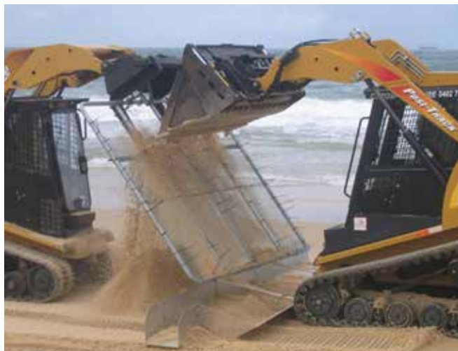
▲ 図17：発生する廃棄物の量を減らすために、砂からターボールを機械的に篩い分ける。