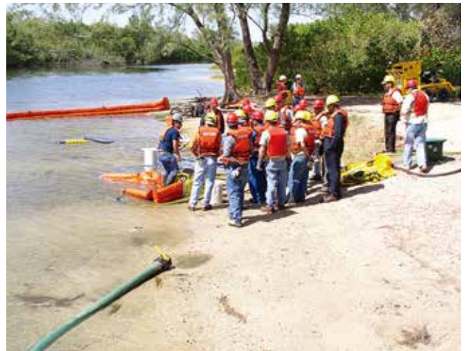
▲ 図11:訓練の一環として資機材を定期的に使用することによって、資機材を維持し、油流出の発生に備え確実な準備をすることができる。