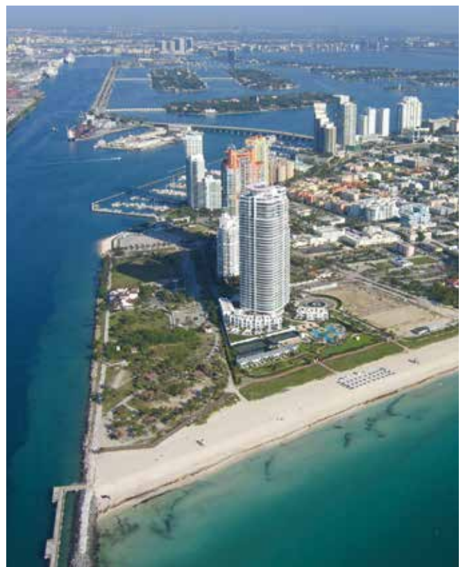
▲ 図1: 近くに住宅地とレクリエーション地域がある主要港。油流出の緊急時対応計画策定の一事例。

緊急時対応計画は対応作業を管理するための構造を持つ。計画の全体の目的は共通かつ普遍的であるものの、計画は実施する国の労働文化を反映するとともに、簡潔で利用しやすく簡単に更新できる実用的な文書であるべきである。地理