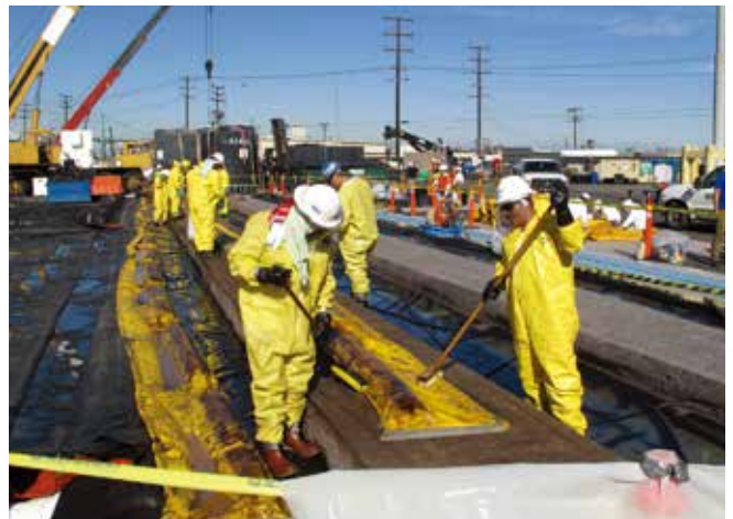
▲ 図12:資機材は次の事故が発生した時にすぐに動員できるように、洗浄し、可能であれば修理しておくべきである。

功させるために必要な後方支援の動員に関する手順も含めるべきである（例えば、対応チームへのPPEや食料の配布、機械の燃料および労働力・資機材・回収廃棄物の輸送のための燃料の配布など）。