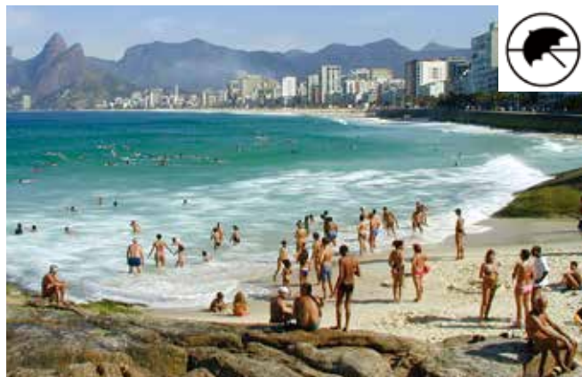
▲ 図8:ホテルやマンションが建ち並ぶエリアに隣接した海水浴場。汚染が発生した場合、特に夏の間はビーチを重点的に注視する必要がある。車両を使うのに適している。