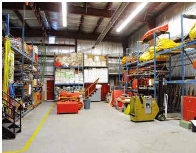
▲ 図9:計画プロセスの一環として、さまざまなシナリオに対処するための適切で十分な対応資機材および物資について計画に明記するべきである。

らの資源は計画関係者が提供するか、必要に応じ購入または契約することが可能である。