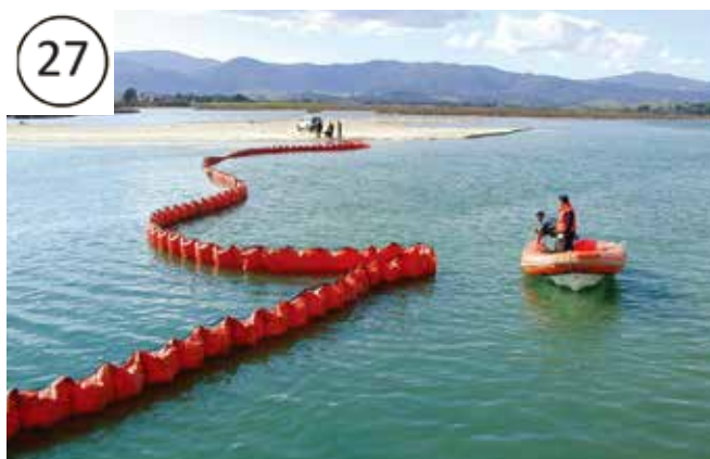
▲ 図5:河口近くに展開されたオイルフェンス。オイルフェンスは油の軌道をアクセスが良い海岸線の回収地点の方向に変えるために設置されている。