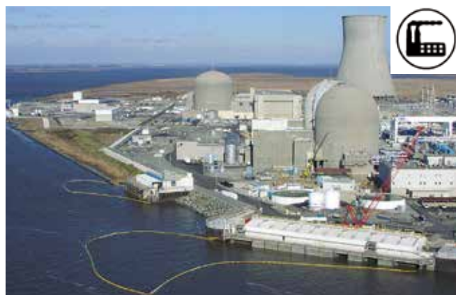
▲ 図6:前方に取水口がある発電所。油の侵入を防ぐために複数のオイルフェンスが誘導展開されている。