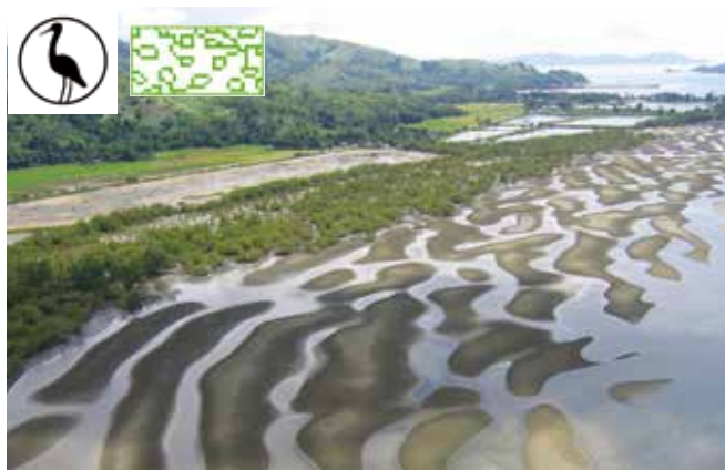
▲ 図7:背後にマングローブや湿地帯がある干潟であり、鳥類のための自然保護区を形成している。この地域に接近する油に対して油処理剤の使用を検討することがあるかもしれないが、沿岸海域での産卵を考慮するべきであり、その結果、1年の特定の時期には使用を制限する場合がある。柔らかい泥は車両や防除資機材を支えられない可能性がある。