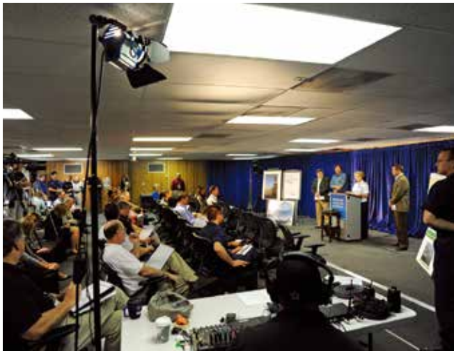
▲ 図10: 対応チームに対して一般の人々やメディアから情報の要求が増大し、効果的な対応能力に支障をきたす恐れがある。こうした問題に対処する方法も計画に組み込むべきである。

の中心的役割を果たすとともに、一般の人々やメディアを含む外部関係者との連絡の要でもある。施設は大規模事故の管理に関わる多くの人々を想定した広さのスペースに、会議室や通信システムを備える必要があるだろう(通信システムとは、指揮センターにおける情報の受発信を円滑にするために必要な電話回線、インターネット接続および無線リンク)。指揮センター内にメディアのための通信および記者会見エリアを別に設けることも検討すべきである。