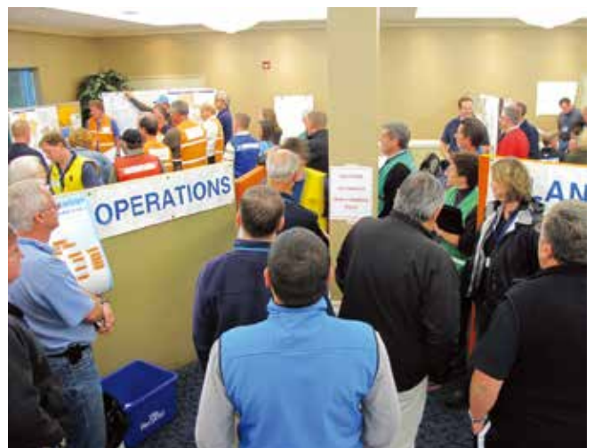
▲ 図2:大規模事故への対応には多くの異なる機関や企業の人員が関わることになる。定期的な訓練を通し緊急時対応計画の試験運用を徹底して行うことによって、すべての参加者が確実に自分たちの任務をよく理解できるようになる。

第一の質問に取り組むためのアプローチの一つは、過去に油流出を起こした事故の形態、すなわち油流出の頻度や流出油の種類・量を調べることである。油流出が起こることは比較的まれであるため、該当地域で十分な定量的評価を行えるだけの過去の流出記録が存在していることはほとんどない。しかし、世界規模で見れば、過去のデータには最も頻度の高い流出原因に関する情報が含まれている。現地の実情にこれらの統計データを適用することで、その地域がさらされているリスクを特定することができる。例えば、多くの油流出は港湾内もしくはその近くで起こること、規模は小さい傾向があること、そして大抵は荷の積み降ろしや燃料補給などの日常的な作業の結果生じていることが分かっている。そのため、石油ターミナルや商業港に寄港するタンカーやその他の船舶の隻数、運んでいる油またはバンカーの種類は、リスク評価に大きく関わってくる。取り扱う油の種類が分かれば、流出後の油の挙動および持続性を予測することができる。