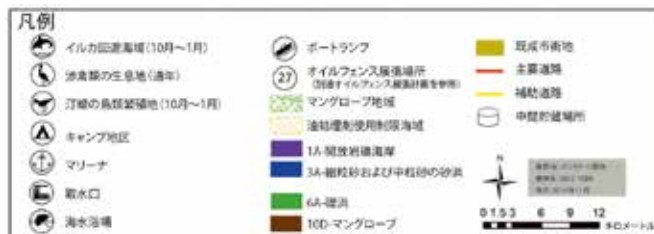
◀ 図4:脆弱性マップ。計画に必要なマップの数および縮尺は、緊急時対応計画の対象地域の広さとマップに表示する特徴の複雑さによって異なる。国の計画に含まれるマップは通常、沿岸域、危険にさらされている資源、および油流出が予想される発生源の主な特徴を大まかに示すだけである。地域計画に含まれるマップは、海面油膜の推定される動きや、合意された対応戦略、海岸アクセスポイント、廃棄物の中間貯蔵場所および処分場など、より詳細な情報を提供する。分かりやすくするために、情報を2つ以上のマップに分けた方がよい場合がある。参考資料として、対応に関する取り決めの要素をより詳細に示しているスケッチや写真を追加してもよい。GISを用いれば、こうした情報を組み合わせるのがより簡単になる。ここでは、脆弱性マップとそのマップに記載されている流出対応の優先エリアの写真を例として示している。