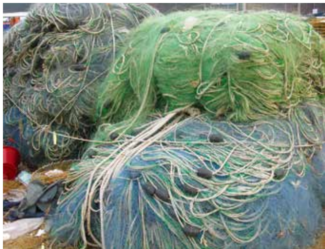
▲ 図5: 激しく汚れていなければ、油で汚れた漁網や壺を洗浄することがある。ただし、場合によっては交換の方が経済的に妥当である。