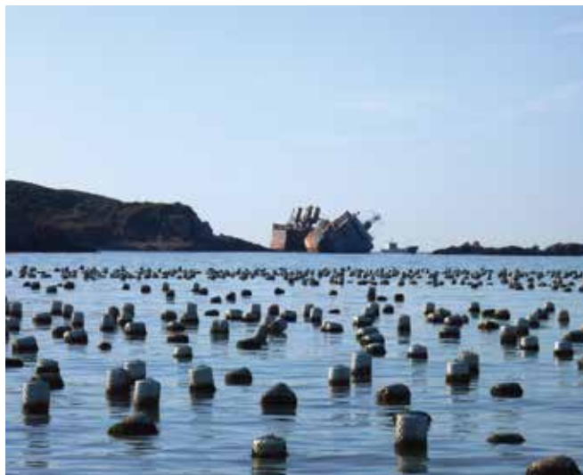
▲ 図2:海藻養殖場。多くの場合、漁業や養殖業は油流出の影響を受けやすい。