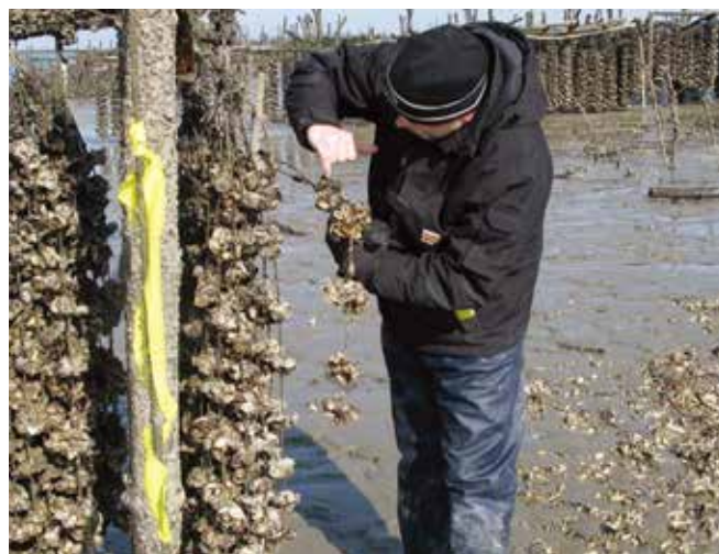
▲ 図19:不必要な漁場の閉鎖を防ぐため、これらの牡蠣のように汚染レベルのモニタリング手順を緊急時対応計画に含めるべきである。

分析のために水産生物の試料を選ぶことは、水や堆積物の試料を選ぶよりも通常望ましい。なぜなら、生物は汚染物質を蓄積し浄化する過程を通して、周りの水や堆積物の状態を効果