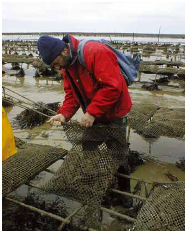
▲ 図16:分析するために牡蠣の試料を回収している。信頼性の高い結果を得るために必要な最低試料数は個々の場合に応じて決める必要がある。

動物や植物の組織試料は腐敗しやすいため、完全な状態を保持するには適切に採取・保管しなくてはならない。試料の損傷及び交差汚染を防ぐために清潔な保存容器(できればガラス製)を使うべきである。低温保存または冷凍保存は、短期間ならば試料の微生物分解に対抗するのに最も便利な保存方法である。採取した試料は密封した後、ラベルを貼り、いつでも分析実験室またはより長い保存のための冷凍設備に運べるよう、十分な保冷剤パックと共に断熱容器に手早く入れなければならない。分析手順によっては、冷凍試料でさえも