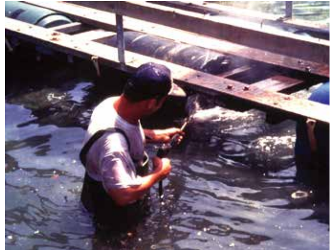
▲ 図11: 養殖施設は加圧洗浄によって現場で清掃することが可能。

吸着材は大量の油の除去には適していないが、タンクやケージ内の水面から薄い油膜を除去するには役立つことが多い