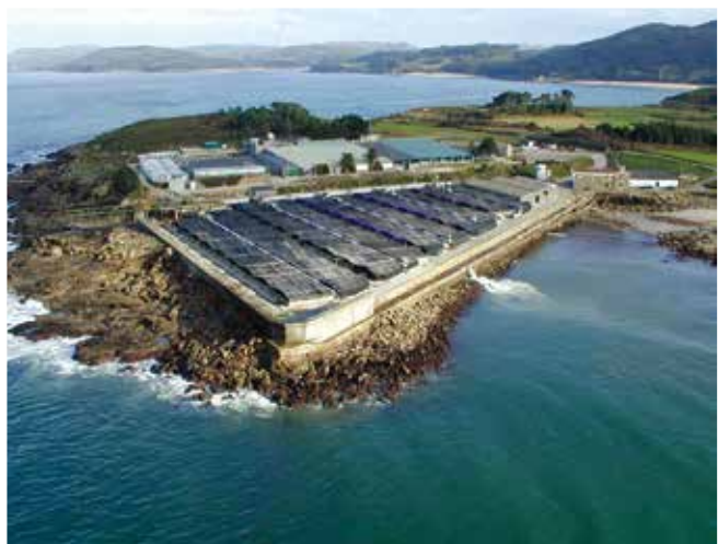
▲ 図7: 陸上の魚の孵化場では大量のきれいな海水が必要となる。海水の吸入口は通常海面下に設置されているため、分散した油によって被害を受けることがある。

より低い濃度でも、試験種を油のより有毒な成分にさらすことで、呼吸や動き、生殖などの多様な生理機能に損傷を与え、卵や幼生の遺伝子変異の可能性を高めることが研究で立証されている。しかし、自然界でこのような致死量以下の影響を検出するのは難しいだけでなく、実験結果の自然界への外挿によって予測され得る資源への広範な影響もまだ観測できていない。同様に、油流出後に卵や幼生が死ぬことがあるにもかかわらず、それに続く天然種の成体数の減少はほとんど記録されていない。これは、さまざまな急性的影響に対する海洋生態系の多大な自然回復力によって部分的には説明できる。海洋生物は、とりわけ卵や幼生の膨大な余剰生産及び被害海域外の資源からの補充によって自然に、高い死亡率にたやすく順応することができる。