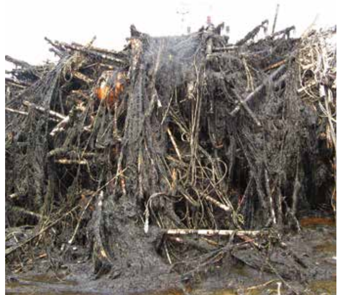
▲ 図12: 油で激しく汚染された海藻の養殖棚。これらは満足のいくレベルまで洗浄することができなかつたため、解体され、新しいものと交換された。