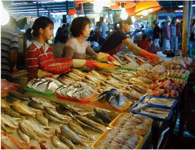
▲ 図10:販売されている魚類—商業漁業活動の中断は、販売経路の至るところ(荷揚げ港からこのような市場の露店などの小売業者まで)で重大な経済的影響をもたらす。

米国環境保護庁(US EPA)は、環境試料においてよく測定対象になる16のPAH化合物を「重要」汚染物質として特定している。また、油流出後の16の重要PAHの合計に基づくガイダンス値を定めている。しかし、PAHは何千もの複合化合物を形成するため、多くの場合「PAH総量」が汚染度の測定に使用される。とはいえ、PAH総量は世界共通の数値を算出するために合算された特定の成分の性質に左右されるため、解釈するのが難しいことが多い。従って、実際に分析したPAHの正体を特定し、同種のPAH同士の比較に基づく汚染レベルの評価を可能にしなければならない。