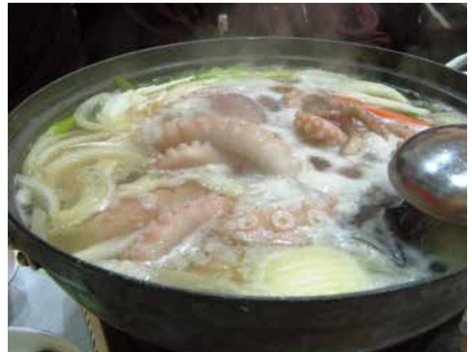
▲ 図9:多くのコミュニティにとって海産物は重要なタンパク源である。

大規模流出に伴う海産物の生命体や商品の汚染は公衆衛生上の懸念につながることがあり、漁業規制を引き起こしかねな