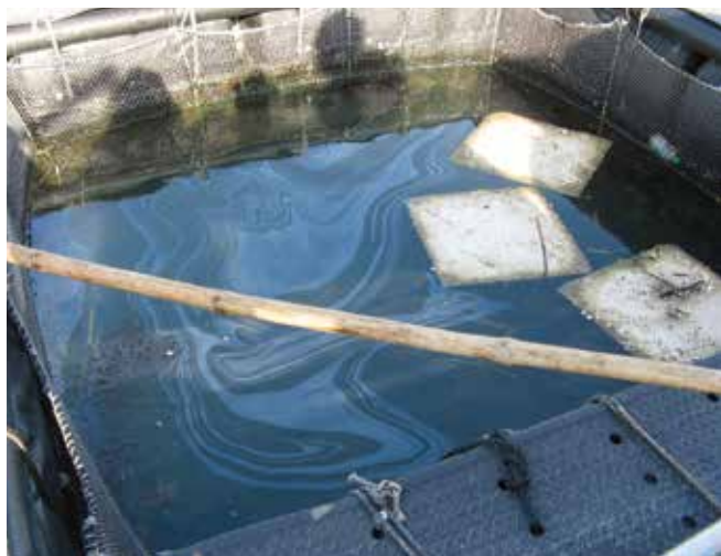
▲ 図14:油で汚れたアワビ養殖場。吸着材パッドは大量の油を除去するには適していないが、魚ケージの中から薄い油膜を除去するのに役立つことが多い。

(図14)。吸着材は陸上施設で海水をろ過するためにも有効に使われている。いずれの場合においても、二次汚染の原因になるのを防ぐために油で汚れた吸着材を交換することは重要である。餌と間違われる可能性があるため、微粒子が散るような吸着材は使ってはならない。