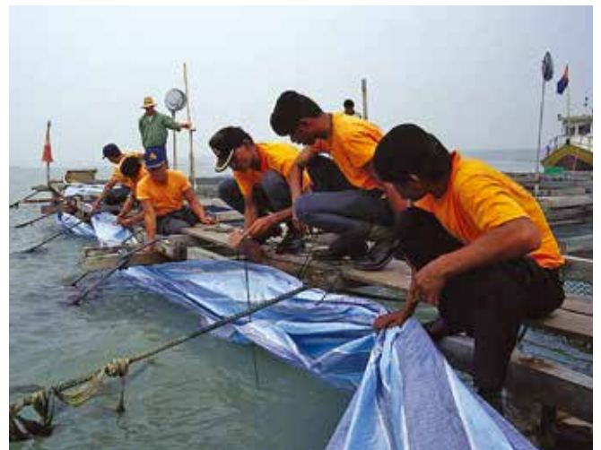
▲ 図13: 通知に十分な猶予があれば、浮遊油による汚染を防ぐため魚ケージの周りに重り付きのビニールシートを張り巡らせることができる。