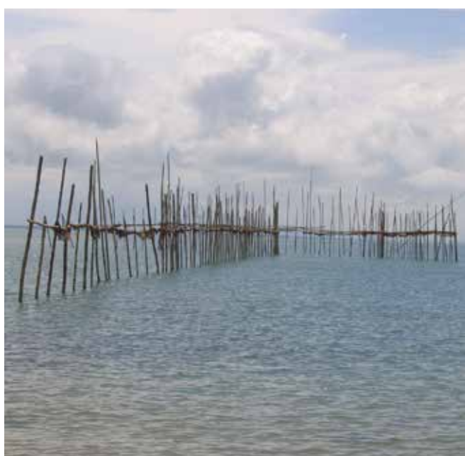
▲ 図6: 建て網は浮遊油による汚染の影響を受けやすい。