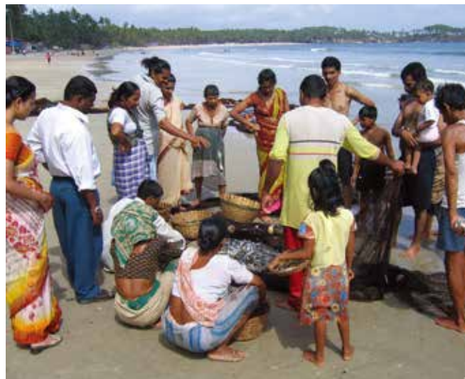
▲ 図3:海沿いの小さな集落の多くは収入及び生計を漁業に頼っており、油流出によって重大な影響を受けることがある。

漁業及び養殖業の季節サイクルは、漁獲または育てる種の種類によって1年を通して変化する。その結果、種の脆弱性または流出油に対する活動も季節に左右される。例えば、アジアで栽培されている大型海藻の中には春から初夏に収穫され、次世代は初秋まで植え付けられないものがある。他の成長の早い種は、年間を通して複数回植え付けや収穫を行う場合もある。海から引いてきた水を使った陸上タンクでの幼生の育成は同じように特定の季節にのみ行われ、通常どの年も数カ月を超えることはない。