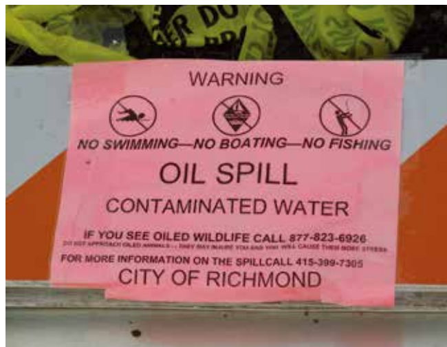
▲ 図15:公衆衛生を守るため、そして油流出後に汚染された生産物が市場に出回らないようにするため、漁業規制がかけられることがある。

海岸タンクや人工池、孵化場においては、海水の吸入を一時停止させシステム内に既にある水を再循環させることが、油汚染の危険から資源を隔離するのに効果的な場合がある。例えば、エビ養殖池への水門を閉じることも短期的には保護を与えることになる。給餌の一時停止は、そうしなければ水面の油膜を通して餌が与えられるのであれば、養殖魚やその他の養殖資源が汚染された餌と接触するのを防ぐ1つの選択肢になり得る。給餌を減らしたり一時的に停止したりすることには、再循環水の中の廃棄物の量を減らせるというもう1つの利点がある。しかし、停滞水または再循環水の中に蓄積した有害な廃棄物によって資源の死亡率が高まらないよう注意を払う