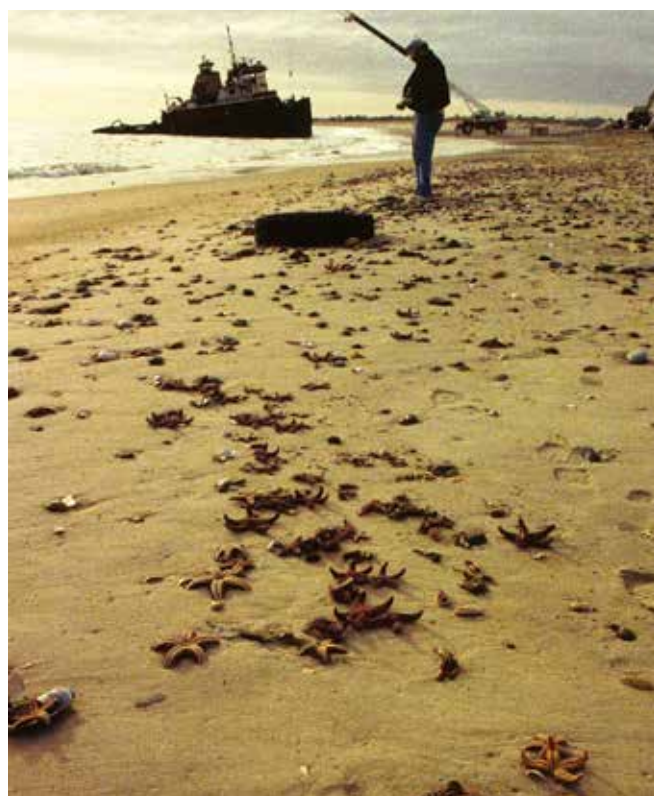
▲ 図4:軽油の流出によって危害を受けたロブスターやヒトデ、貝類が風によって浅瀬にまき散らされている。

一般的に、軽質原油やガソリンまたは灯油などの軽い精製品は急性の毒性作用を持つ低分子量芳香族化合物を比較的