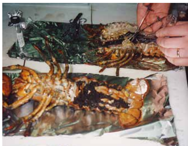
▲ 図17:感覚検査を行う前に魚類や貝類は通常蒸し加熱される。これらのロブスターは加熱後に開かれ、白い身の部分を使って嗅覚と味覚による有害成分の検査が実施される。