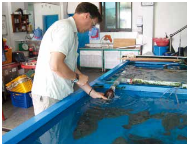
▲ 図18:陸上にある屋内養殖場での水試料の採取。分析によって資源が汚染されている可能性が示唆されるかもしれない。

ある。再現性のある結果を得るとともに偏りを最小限に抑えるためには、検査は「目隠しテスト」という形で実施すべきである。つまり、検査員は基準（コントロール）試料や有害成分に汚染されている可能性のある試料の正体について知らない状態で実施しなくてはならない。