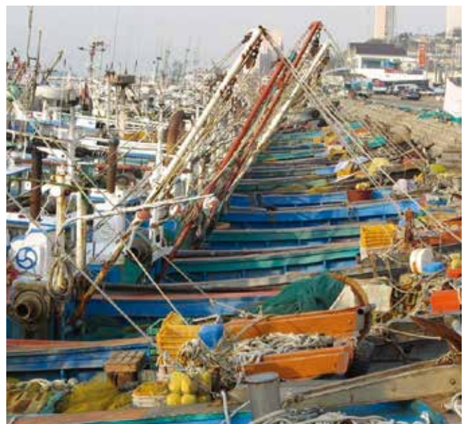
▲ 図1: 流出した油によって漁船団が船舶や道具の汚染、または禁漁といった被害を受けることがある。どちらの場合も船団が港に留まることを余儀なくさせる可能性がある。

最大の影響は、動物や植物が物理的に油に覆われ窒息するか長期間有毒成分に直接さらされる沿岸部で見られる可能